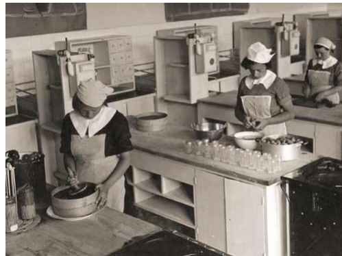
Ek 3. İsmet Paşa Kız Enstitüsü Talebesi (1928) (MEB, 2019, s. 168).