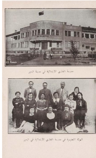
Şekil 1. İzmir şehrinde Gazi İlkokulu İzmir Gazi İlkokulu’nun Eğitim Kadrosu (el-Cemâlî, 1938, s. 28-29)

Kitabında, ilkokullara örneklik sağlaması bakımından aşağıda Şekil 1’deki fotoğrafa da yer vermektedir: