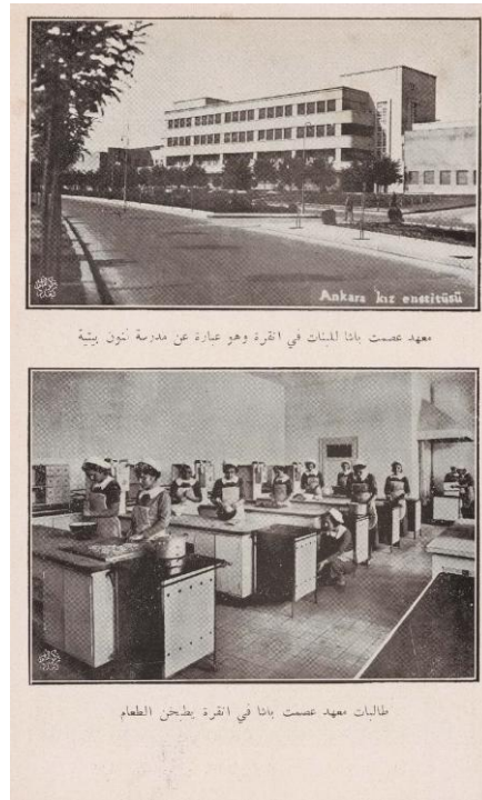
Şekil 2. Ankara'daki İsmet Paşa Kız Enstitüsü; Ev Sanatları (Ev Ekonomisi) Okulu Niteliğindedir. Ankara'daki İsmet Paşa Kız Enstitüsü Öğrencileri Yemek Pişirirken (el-Cemâlî, 1938, s. 51).

Yukarıdaki cümlelere göre, kızlar meslek okullarında güçlü bir şekilde ev içi rollerine de hazırlanmaktadır. Ev içi rollerini bilinçli bir şekilde benimseyen kızlar sayesinde, daha mutlu bir aile yapısının ortaya çıkacağı varsayılmaktadır. Kitabında, bu kurumlara dair bazı fotoğraflar da vermektedir. Aşağıdaki Şekil 2 ve Şekil 3’deki fotoğraflar buna örnek verilebilir: