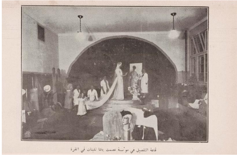
Şekil 4. Ankara'daki Kız Enstitüsü'nde Biçki (Terzilik) Salonu (el-Cemâlî, 1938, s. 57-58)

Bu tür okullardaki eğitim ile ilgili ise aşağıdaki bilgileri vermektedir: