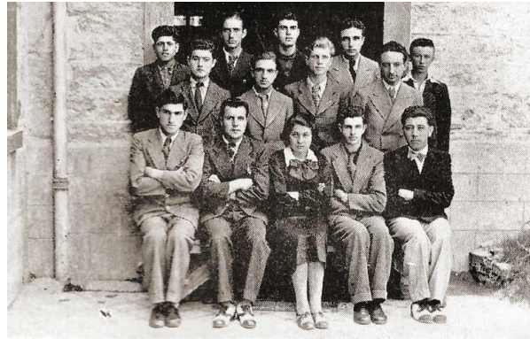
Ek 2. İzmir Ticaret Mektebi Öğrencileri, Konak İzmir Mesleki ve Teknik Anadolu Lisesi Arşivi (1924) (MEB, 2019, s.147).