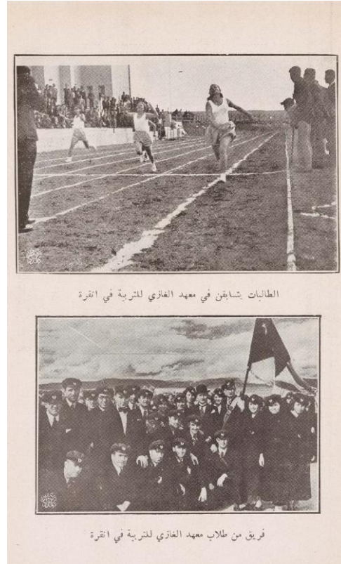
Şekil 5. Ankara’daki Gazi Eğitim Enstitüsü’nde Kız Öğrenciler Yarışıyor Ankara’daki Gazi Eğitim Enstitüsü Öğrencilerinden Bir Ekip (el-Cemâlî, 1938, s. 71-72)

Kız ve erkek öğrencilere ayrı şekilde programa konan bu dersler, ilköğretim ve lise düzeyinde de görülmektedir. Dolayısıyla 1937’de ortaokul, lise ve öğretmen yetiştiren kurumların programlarında, ev idaresi ve çocuk bakımıyla ilişkili rollerin kız öğrencilere okul aracılığıyla planlı biçimde aktarıldığı anlaşılmaktadır. Aynı zamanda el-Cemâlî, Türkiye’deki öğretmen okulları mezunlarının öğretmenlik mesleğindeki yetkinliği bakımından yüksek bir düzeye sahip olduğunun altını da çizmektedir (el-Cemâlî, 1938, s. 69-70). Kitabında, Gazi Eğitim Enstitüsü ’nde kız öğrencilerin faaliyetlerine ışık tutabilecek, aşağıda Şekil 5’de gösterilen fotoğrafa yer vermektedir.