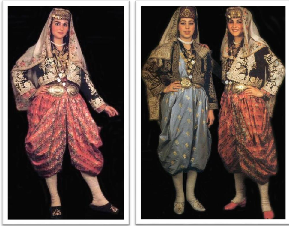
Fotoğraf 2-3. Beypazarı Geleneksel Kadın Giysisi (Tüzün, 1986;38-40)

Kadınlar bu giysileri sıra altınlar, beşbiryerdeler, inci, tılsım, küpe, kolye, bilezik, iğne, altın ve gümüş kemer gibi aksesuarları tamamlayarak kullanırlar. Bu merasim kıyafetlerinin üzerine mermerşahi kumaş üzerine köşe motifleri zengin bordür şeklinde metal iplikle işlenmiş çevre olarak bilinen kare şeklinde başörtüsü örterler (Bahar; 2013;143)