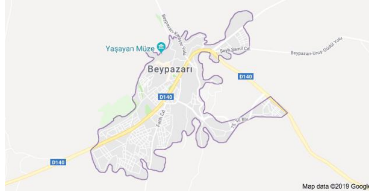
Fotoğraf 1. Beypazarı haritası ( https://www.google.com/maps/place/Beypazarı )

Beypazarı'nı Rumlardan, Kütahya Beylerinden Germiyanoğlu Yakup Şah'ın Veziri Dinar Hezar alarak Osmanlı topraklarına katmıştır. Adı fethedenin hatırasını yaşatmak amacıyla "Beyhezarı" olmuştur. Bey buraya panayır şeklinde büyük alışveriş yerleri kurarak büyük bir pazar yeri haline gelmesini sağlamıştır. Sonradan bu pazar oldukça meşhur olarak "Beğpazarı" olmuş sonradan bugünkü bilinen "Beypazarı" şeklini almıştır (Cankara, 2009;32)